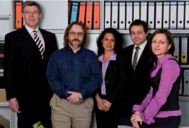
Wir freuen uns auf Sie – das Vertriebsteam

Ein Ansprechpartner für die gesamte Auftragsbearbeitung gewährleistet unseren Kunden eine unkomplizierte und schnelle Kommunikation.